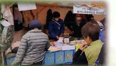
保谷支部・マドレーヌ・雑貨販売