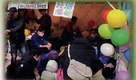
田無支部・ヨーヨー釣り