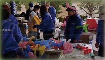
小平支部・くじびき