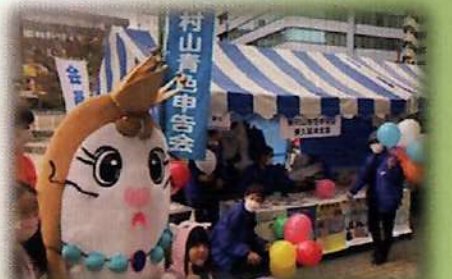
東久留米支部・じゃんけん大会

コロナ禍の終息後、久しぶりに開催された各市のお祭りには多くの来場者が訪れました。寒い中での開催でしたが、多くの人々が各市のイベントを楽しんでいました。役員の皆様やご支援いただいた方々は、寒さの中積極的な広報活動を行ってくださり、そのご協力に心から感謝申し上げます。