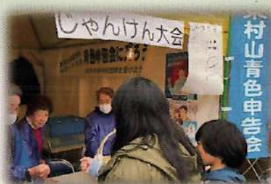
東村山支部・じゃんけん大会