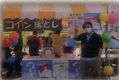
清瀬支部・コイン落とし